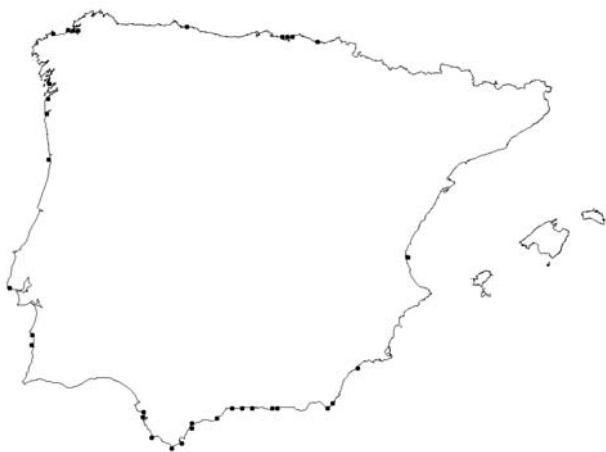
Mapa 1. Plocamium raphelisianum . Localización geográfica de los ejemplares estudiados en las costas peninsulares.

P. raphelisianum es un taxon que se conoce en las costas africanas desde Senegal hasta la costa atlántica de Marruecos (Dangeard, 1949; Gayral, 1958; Benhisoune & al., 2002; John & al., 2004) e Islas Canarias